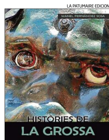
Portada d'«Histories de la Grossa»